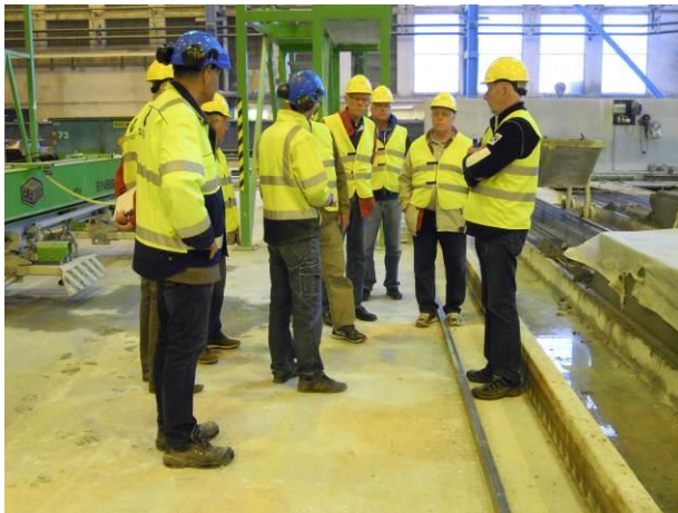
Företagsbesök på Kynningsrud Prefab