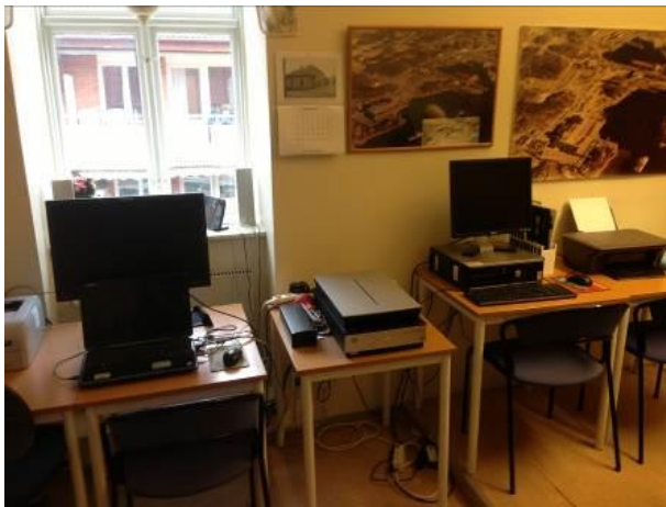
Våra lokaler på Lotcen, Kungsgatan 30