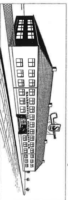
SKAPD:s nya fabrik som stod färdig 1945